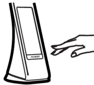
Paina näppäintä laittaaksesi lampun päälle/pois